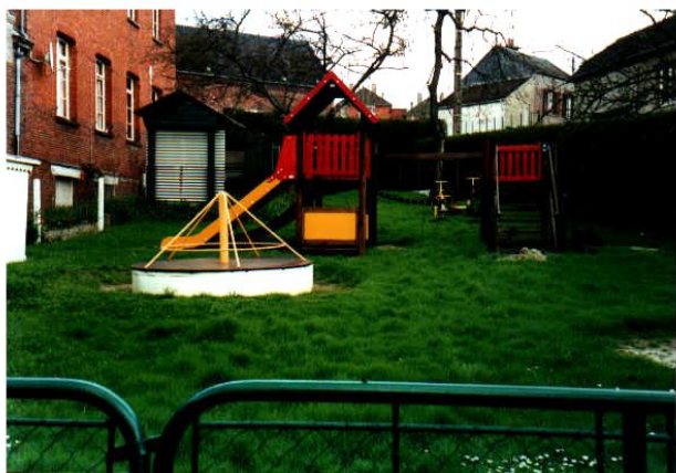
Jardin de la maternelle

Kermesse: un dimanche en juin 2016 , précédée d'une messe célébrée à 10H30 et d'un repas Hall du Pays d'Auge.